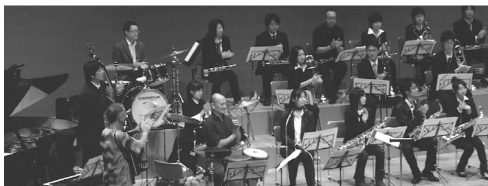
JMIAジュニア・ジャズオーケストラのOBら高校生が中心となって結成。