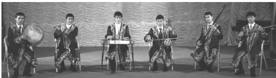
引率ディレクター1名、演奏者7名をウズベキスタンより招聘。