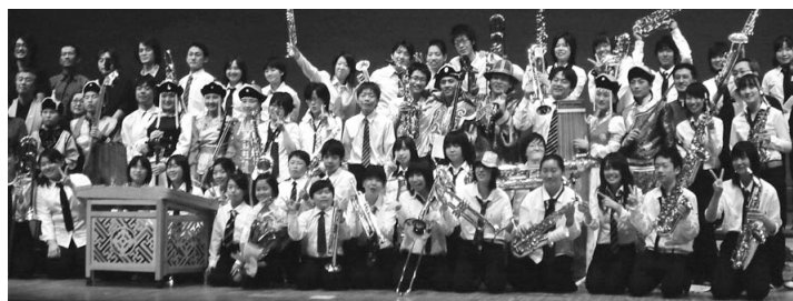
1998年に誕生したジュニア・ジャズオーケストラ。主に旭川市内の小中学生で結成。