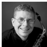
スティーブ・サックス (サクソ)